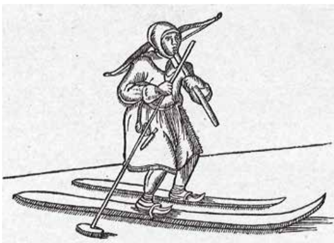
Ein Lappländer auf Langski (Holzschnitt, Frankfurt a. M. 1673).

Der Fremdenverkehr, vorerst in Form von Bergtourismus, führte zu einem neuen Erwerbszweig. Zur Förderung der wirtschaftlichen Zielsetzung entstanden in diesem Zeitabschnitt sehr viele Vereine, die meistens vor den Karren für die Tourismusbelebung gespannt wurden. Nicht zu vergessen ist in diesem Zusammenhang auch das Wirken von Turnvater