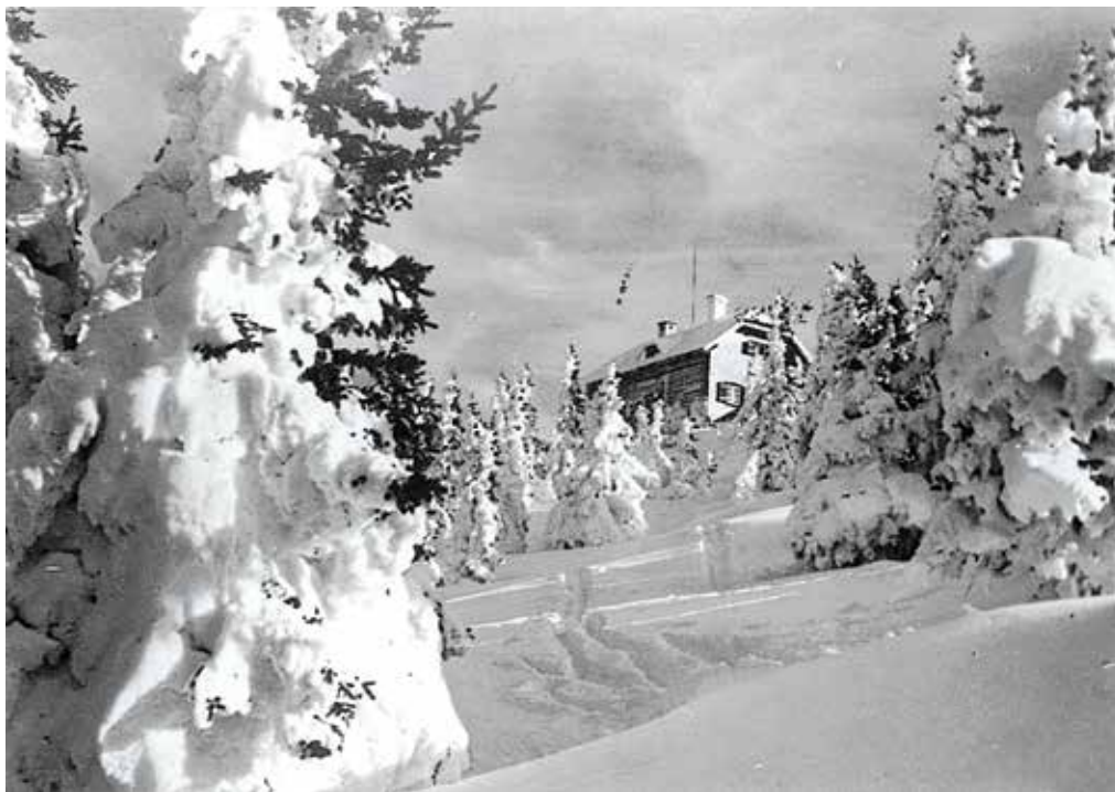
Die Schladmingerhütte aus der Zeit der Bauphase von 1926 bis 1932.

Zu jener Zeit verblasste die steirische Vorherrschaft im Skigeschehen schon etwas, denn westliche Skiorte wie Kitzbühel, Zell am See und der Arlberg hatten wegen ihrer Schneesicherheit schon einen klingenden Namen. Auch im Ennstal und im Steirischen Salzkammergut setzte man schon auf eine Steigerung des Winterfremdenverkehrs. Über Anregung des Herrn Ferdinand Reichsritter von Pantz, wurde im Winter 1909 die erste gemeinsame Großveranstaltung mit der sogenannten "WISSET" ins Leben gerufen. Schladming, Mitterndorf, Bad Aussee und Admont und teilten sich die Veranstaltungen. In Schladming