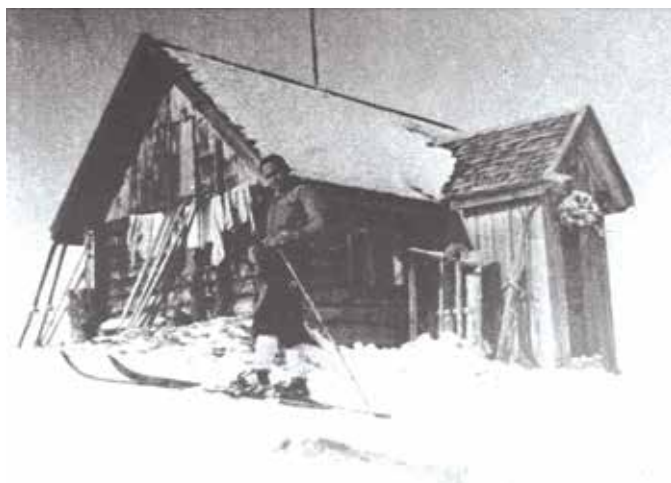
Die 1920 errichtete Hochwurzenhütte.

allem eine Anlaufstelle für Militär-Skikurse. Auch einheimische Damen waren eifrig auf den Brettern, und die Jugend war zum Leidwesen der älteren