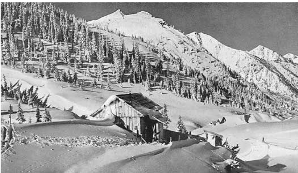
Plannerhütte gegen die Schoberspitze, Naturaufnahme von Karl Sandtner (aus einer Zeitschrift des Deutschen und Österreichischen Alpenvereines, 1911).

Das erste Skirennen des Ennstales wurde 1904 als